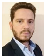
Γράφει ο Κώστας Παππάς

Τ η θετική στάση των εργαζομένων για την τηλεργασία και την καθιέρωσή της επιβεβαιώνει η έρευνα που διεξήγαγε το Εργαστήριο Διοίκησης Ανθρώπινου Δυναμικού, το οποίο υποστηρίζει επιστημονικά το Μεταπτυχιακό Πρόγραμμα στη Διοίκηση Ανθρώπινου Δυναμικού, του Οικονομικού Πανεπιστημίου Αθηνών.